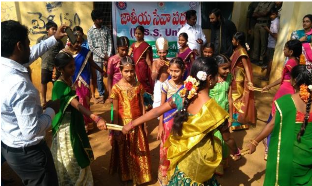
Conduction of cultural programs by NSS team