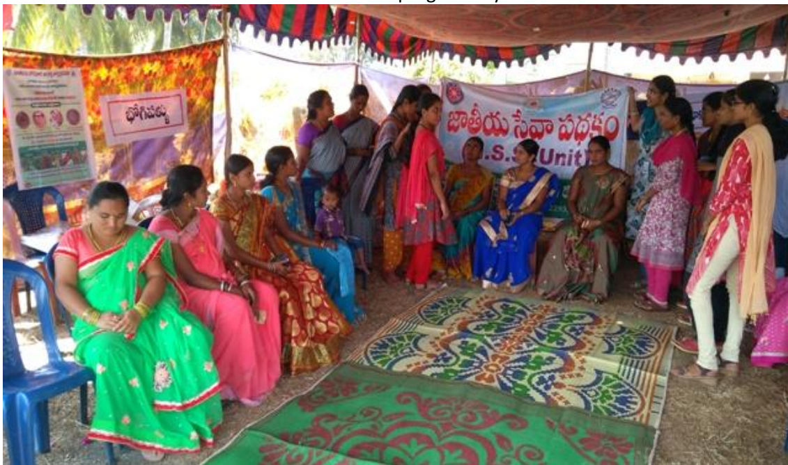
Conduction of seemantham program by NSS team