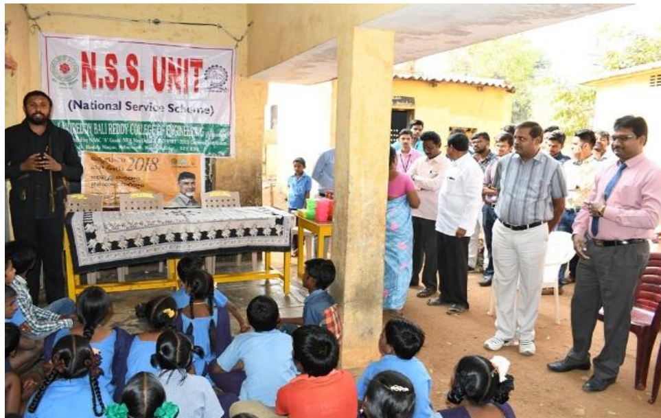
Stage of Distribution of Prizes to school children