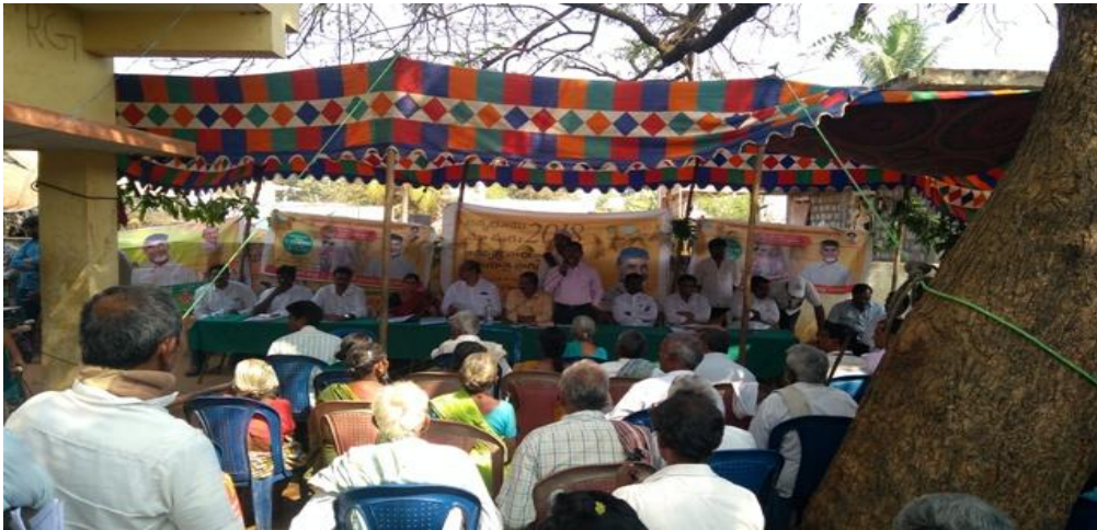
MYLAVARAM MRO ADDRESSING AT PROGRAMME